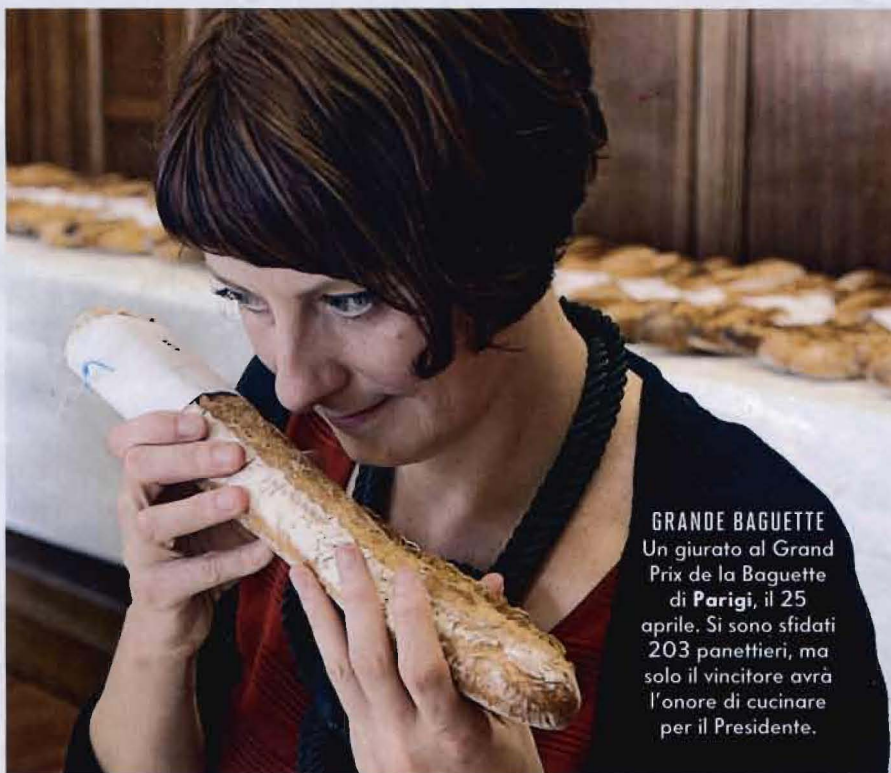
GRANDE BAGUETTE Un giurato al Grand Prix de la Baguette di Parigi, il 25 aprile. Si sono sfidati 203 panettieri, ma solo il vincitore avrà l'onore di cucinare per il Presidente.